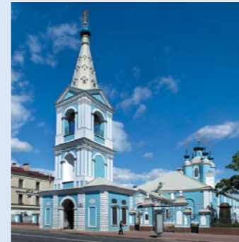
Сампсониевский собор — храм-памятник русской ратной славы, возведенный в Санкт-Петербурге в 1710 году по приказу императора Петра I