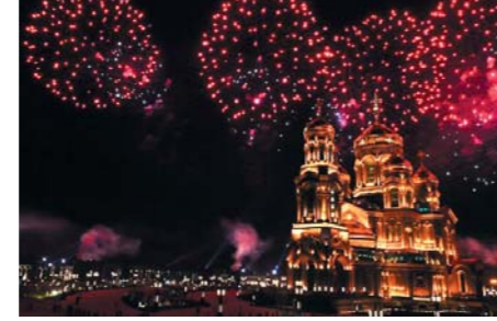
Главный храм Вооруженных сил РФ, «посвященный 75-летию Победы в Великой Отечественной войне, а также ратным подвигом русского народа во всех войнах». Храм описан мультимедийным мемориальным комплексом «Дорога памяти», галерея которого содержит более тридцати миллионов фото участников войны и рассказы о каждом ее дне. Строительство завершено 9 мая 2020 г., освящен 14.06.2020 г. Расположен в городе Кубинка Московской области.

миллионы нас, что шли «Полком Бессмертным» плечом к плечу пойдут на смертный бой. И с нами Бог — хранитель милосердный — России жить великою судьбой.