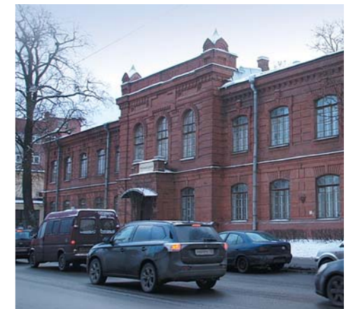
Здание механического завода «Новый Леснер»