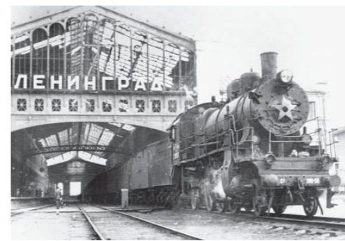
Вид Финляндского вокзала со стороны путей